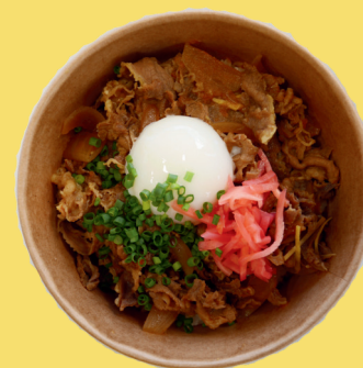
Gyudon Curry à la tomate

Un bol de riz + du bœuf finement tranché + de l'oignon fondant au curry à la tomate accompagné d'un œuf parfait, servi avec de la ciboulette et du gingembre rouge