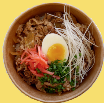
Gyudon signature de la maison

Un bol de riz + du bœuf finement tranché + de l'oignon fondant à la sauce japonaise accompagné d'un demi œuf mollet, servi avec de la ciboulette, du gingembre rouge et du blanc de poireau